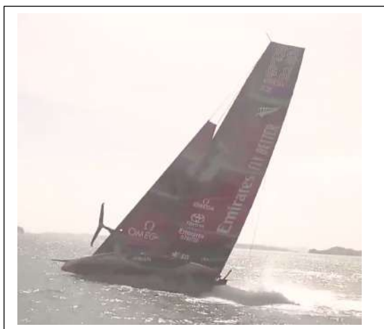
+ 52 Le bateau est stoppé et gîte