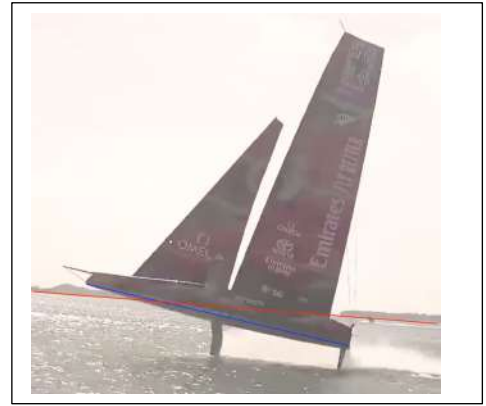
+ 14 s