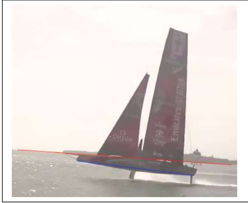
T = 0 s Début de la perte de contrôle.