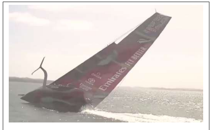
+ 66 s La gîte augmente inexorablement