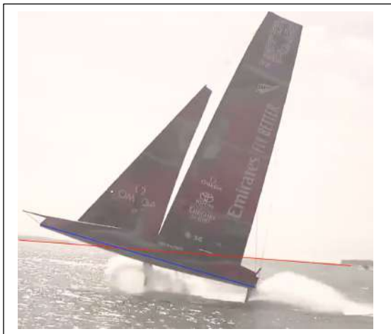
+ 26 s L'incidence du Foil augmente... et Décrochage... chute immédiate + 40 s